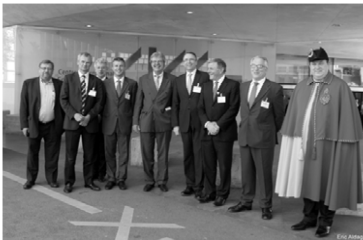
Accueil du ministre, M. Michel Mercier (France)