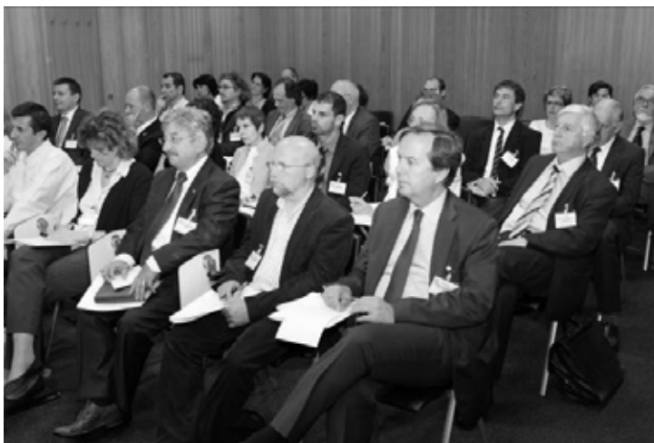
Participants de l'atelier «Gouvernance de la région : contraintes juridiques et institutions»