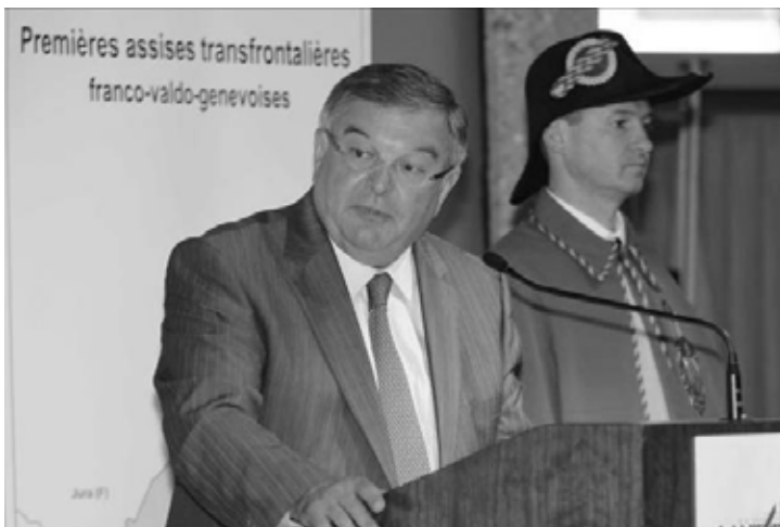
M. Michel Mercier, ministre de l'espace rural et de l'aménagement du territoire (France)