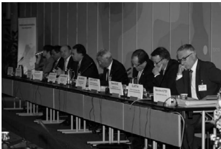
Les coprésidents et rapporteurs des Premières assises transfrontalières