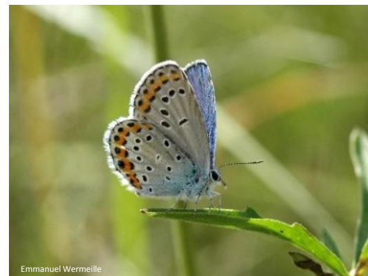
Emmanuel Wermelle Azuré des coronilles

L'Azuré des coronilles, papillon classé en danger, a été identifié comme espèce d'intérêt supérieur pour l'ouest vaudois. Les milieux secs, où sa présence est avérée, sont éloignés les uns des autres et de faible surface. L'action vise à améliorer les habitats occupés ou favorables à l'espèce afin de maintenir des échanges entre les différentes populations. L'inventaire des sites occupés par l'espèce et de sa plante hôte ont été réalisés en 2017. Un plan de gestion a été élaboré et proposé dans le cadre de conventions de gestion, en collaboration avec les réseaux agro-écologiques concernés.