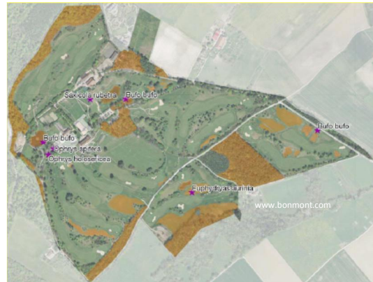
(carte : N+P)

Ce golf s'étend sur la commune de Chésereux et présente des milieux biologiques variés (prairies, forêts, petits plans d'eau). Le plan de gestion différencié, élaboré en 2017, sera mis en œuvre dès 2018. L'engagement du Golf de Bonmont dans la conservation des valeurs naturelles et la promotion de la biodiversité est saluée.