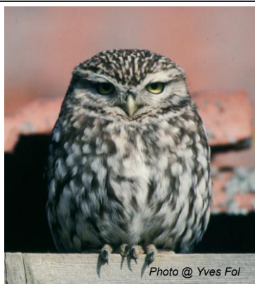
Chevêche d'Athéna ( Athene noctua )