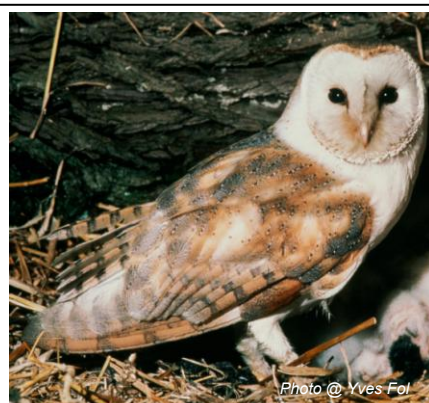
Effraie des clochers ( Tyto alba )

Une série d'actions a permis aux habitants et aux élus du territoire du contrat corridors champagne Genevois de découvrir les enjeux liés au maintien des corridors biologiques, à l'image du premier inventaire participatif « oiseaux de nos campagnes » lancé en mai 2013.