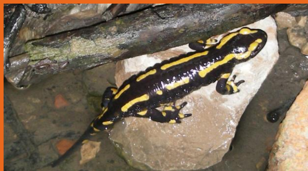
Mars 2013 : Une Salamandre tachetée adulte de 25 cm remonte le ruisseau de la Tour-de-Pinchat. Son observation reste un événement rare dans les zones bâties. Les lieux de reproduction de la Salamandre, une espèce spectaculaire mais sensible, doivent être préservés.