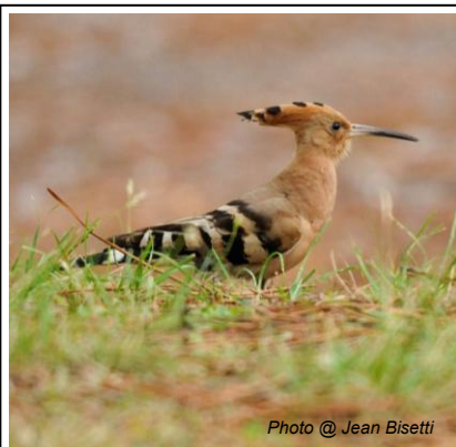
Huppe fasciée ( Upupa epops )